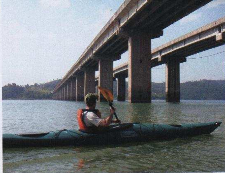
Ponte sobre a Rodovia D. Pedro I é um atrativo interessante