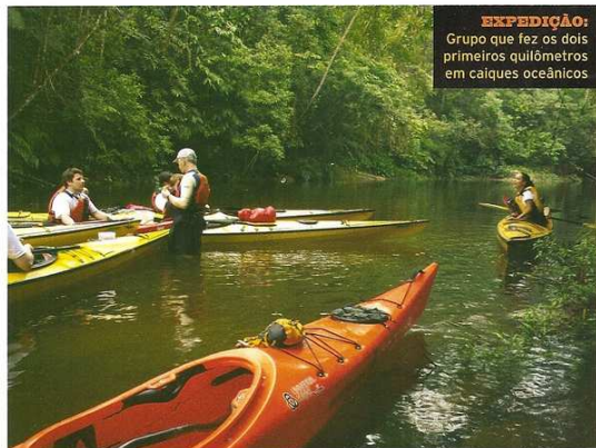
EXPEDIÇÃO: Grupo que fez os dois primeiros quilômetros em caiaques oceânicos.

No dia da nossa remada, tivemos a sorte de encontrar vários tipos de pássaros – como pica-paus, martins-pescadores e até três casais de tucanos –, que