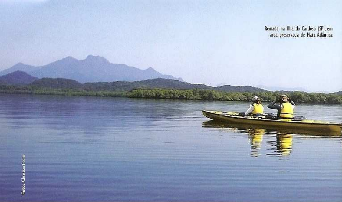
Remada na Ilha do Cardoso (SP), em área preservada de Mata Atlântica