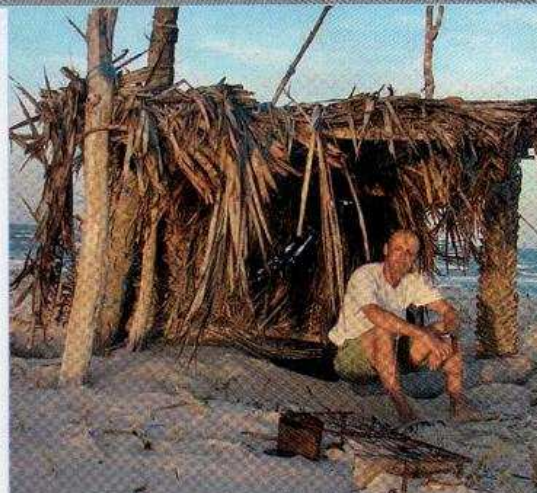
Sem chuva ou vento forte, a barraca de palha resolvia

Em setembro de 1941, os cariocas ficaram perplexos com a chegada de quatro jangadeiros à Baía de Guanabara, depois de uma jornada de 3 mil quilômetros desde a Praia de Iracema, Fortaleza. O objetivo dos destemidos velejadores era protestar na então capital federal contra a situação de abandono dos pescadores no Ceará. Meses depois, essa incrível história virou tema de um filme do diretor americano Orson Welles recém-consagrado por Cidadão Kane . Tragicamente, um acidente nas filmagens no Rio de Janeiro matou “mestre Jaca”, líder dos jangadeiros. O filme, intitulado It's all True (“É Tudo Verdade”), jamais foi finalizado por Welles, mas ganharia uma montagem em 1993.