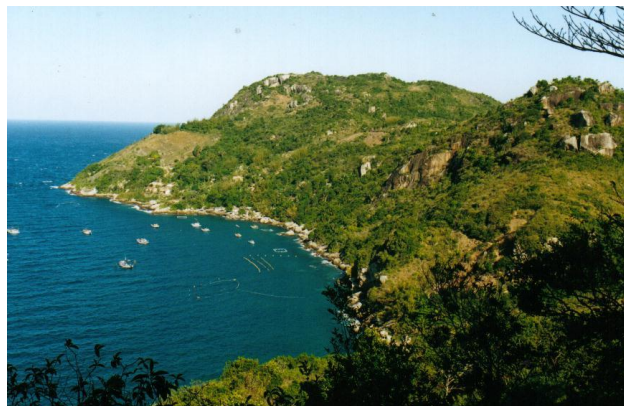
Ponta da Juatinga