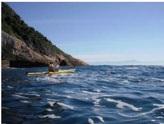
Ponta da Juatinga

Apesar da proximidade das maiores cidades do Brasil, a Expedição Paraty – Ubatuba passa por regiões ainda desabitadas e sem acesso, cheias de praias desertas, baías recortadas e mar aberto. Uma expedição de aproximadamente 100 km, que vai botar à prova as suas habilidades canoísticas e com certeza não vai sair da sua memória tão cedo!